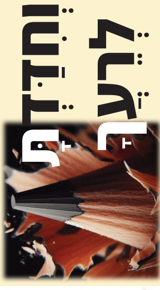
מצא לפחות חמשה הבדלים